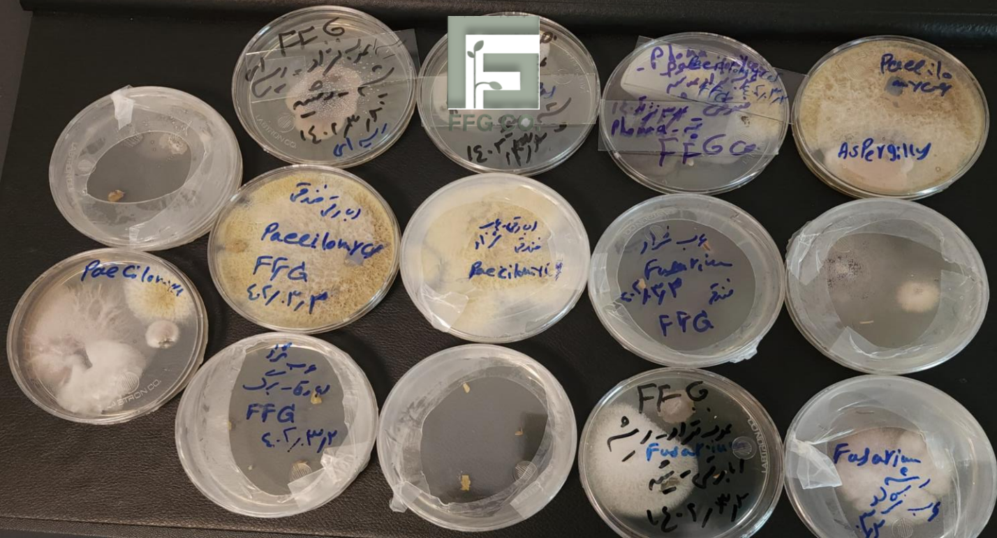
پتری های حاوی پرگنه های قارچ های مختلف