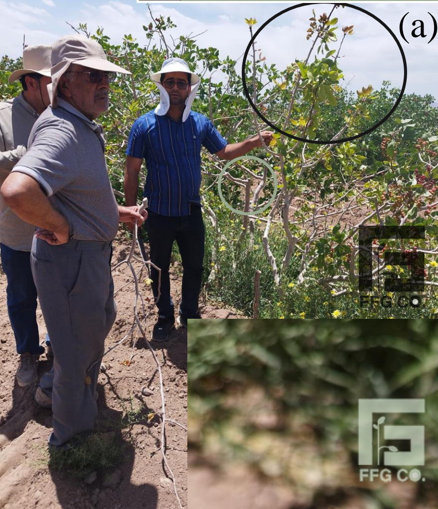
علائم سرخشکیدگی روی درختان، برگریزی و ضعف عمومی