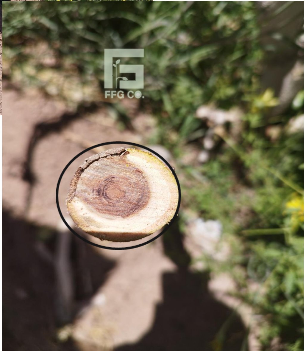
نکروز مرکزی در مقطع عرضی شاخه درختان